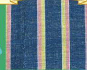
コートジボワール