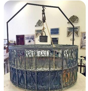
ザムザムの水が湧き出していた場所。現在は機械が使われています。

「ザムザムの水」とは、約5000年前、預言者イスマイルの足元に湧き出た水と言われています。預言者の母ハジャルがのどの渇きに苦しんでいた息子を救うために 2 つの丘の間を 7 回走ったところ、地面から湧き出したそうです。世界中で永遠に湧き出す奇跡の水として様々な言い伝えがあり、永遠に清らかな「ザムザムの水」はインクを垂らしても濁らず、汚れず、澄んだままという話もあるそうです。