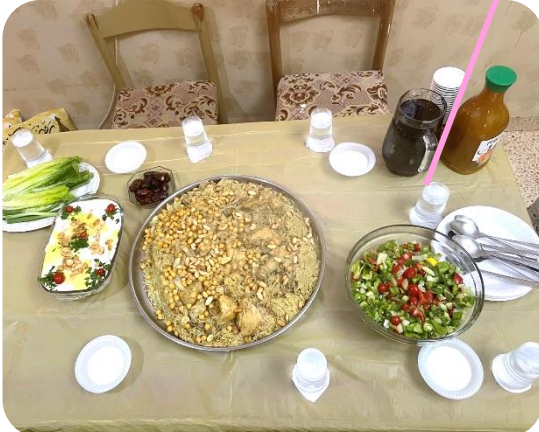
今回いただいたアラブ料理