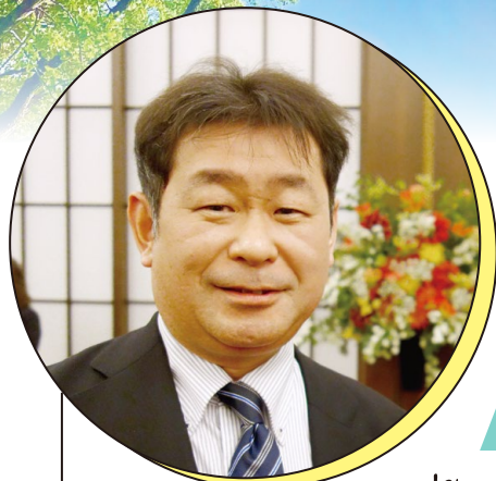
山上 正道 Seido Yamagami