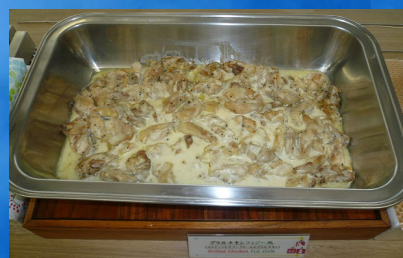
グリルチキン フィジー風