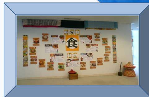
ミニ展示「世界の食」

※当店はバイキング形式となっております。レジにて料金をお支払い後、バイキングをお楽しみください。