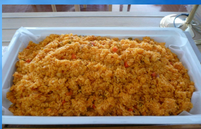
アロス コン ポーヨ