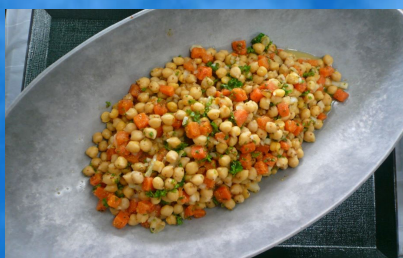
ガルバンゾのサラダ