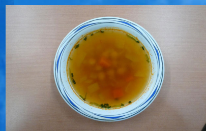
モロッコのひよこ豆スープ