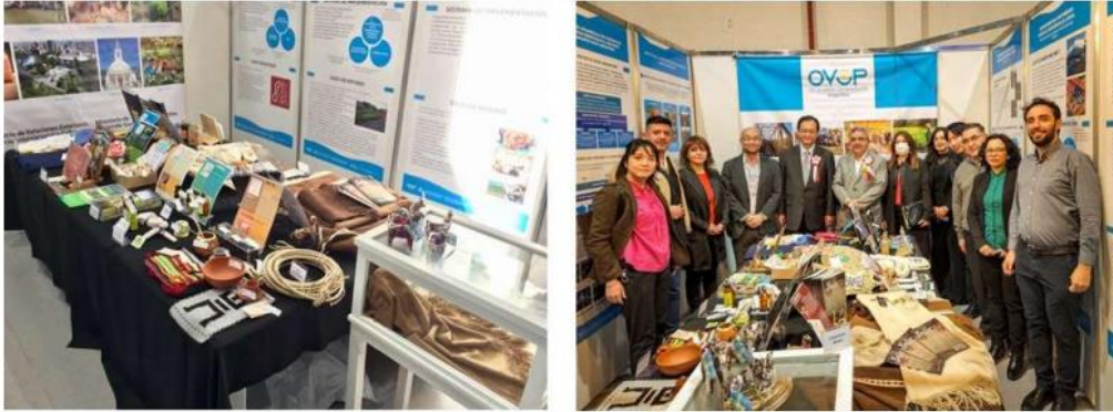
写真：アルゼンチンで実施した一村一品商品の展示会

当機構は、SDGs（持続可能な開発目標）の目標達成のために力を入れて取り組んでおり、本案件は、SDGs 目標8の“働きがいも経済成長も”を主な目標に取り組んでいます。