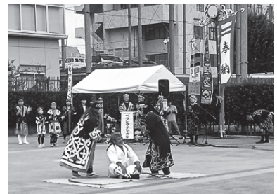
写真1 2024年10月6日 チャランケ祭にて筆者撮影

2024年4月21日、沖縄県立芸術大学において「二風谷・アイヌ×沖縄県立芸術大学『あしびとういけー』プロジェクト」が開催された。北海道沙流郡平取町二風谷から「アイヌ古式舞踊」の継承に携わる若手6人を講師に迎え、二風谷で伝承されてきたアイヌ古式舞踊を体験し、北の大地で培われたアイヌの文化、歴史、人と自然との関わりを学ぶ機会として、同大学の呉屋淳子氏が企画した。「前半は二風谷のアイヌ古式舞踊「エムシリムセ」(剣の舞)、「チャビヤク」(アマツバメの踊り)ほか2曲を披露した後、参加者全員が踊りを体験。後半は同大学教員、学生、卒業生、琉球芸能の継承に関わる若手が歌三線と沖縄の踊りでリードし体験交流した。企画した呉屋氏は「会場の皆が歌や踊りで交流することで、より身近に感じ、ディスカッションでどんなことを考え、文化の継承に携