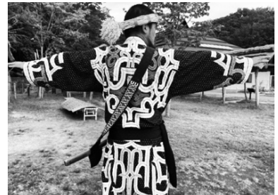
写真 2 2024 年 9 月 7 日 白老町ウポポイにて筆者撮影

以上に紹介した人々の声は断片的であり、すべてのアイヌの人々を代弁するものではないが、文化交流や保持に努める人々の意識として、授業づくりへの視点となる。