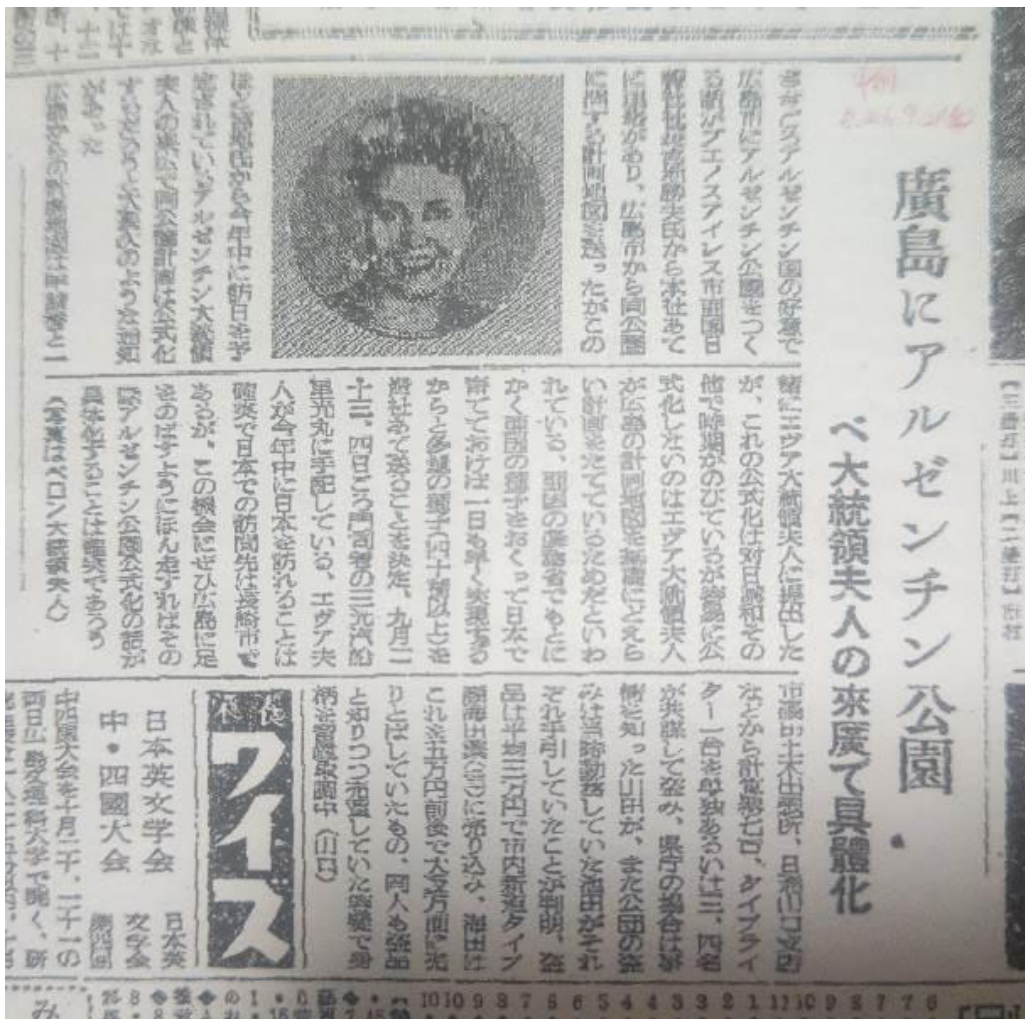
23 マイクロフィルムを設置中