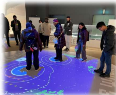
<JICA留学生を対象とした地域理解プログラム「阪神・淡路大震災からの復興」>