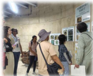
<神戸市水道局視察>

※3 2025年度実績。開発途上国からJICAの研修事業(数週間～最長3年(博士課程留学))への参加者を指す。短期は1年未満の研修業務を指す。参加者は概ね先方政府の行政官。他にもビジネスや学術界の中堅リーダーなどが参加。研修を通じて知見・技術を共有し、自国の発展のために活かすうえで核となる人材。