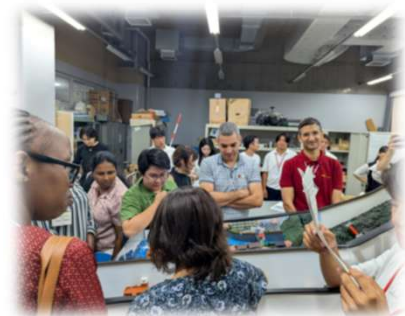
<神戸市立科学技術高等学校との防災教育交流会>