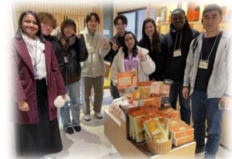
<JICA留学生を対象とした地域理解プログラム「和歌山のみかん産業の発展と課題」>