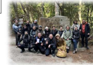
<西バルカン観光研修 熊野古道>

※4 受入期間が1年以上の研修員で、日本の大学院の修士/博士課程を通じ、母国の開発に寄与するための総合的かつ高度な技術や知識の習得を目指しています。