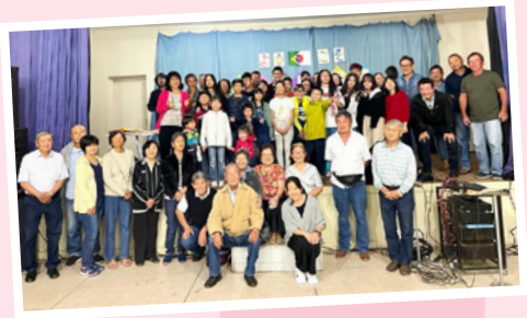
アリアンサの皆さんと

さて、そんな「第一アリアンサ村」ですが、長野県と深い関係があるんです。なんと第一アリアンサ村をつくったのは長野県民なんです。1924年に最初の人たちが大変な苦勞をして、もともと原始林だったこの地を一から開拓して今の第一アリアンサ村があります。そんな第一アリアンサ村ですが、今年なんと開拓100周年を迎えます。現在、「開拓から100年経った『今』のアリアンサを残したい」と思い、村のインスタグラムを作成したり、村の人たちとクラウドファンディングをして資金を集めて100周年を盛り上げようとしていたりしています。