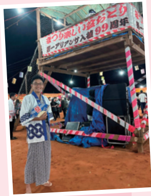
ブラジルで盆踊り

もちろんそれらも素晴らしい国なのですが、実はブラジルは世界で最も日系の方々暮らし国なんです。現在ブラジルには約200万人もの日本にルーツがある方々が生活していると言われています。地球儀で見ると日本の真反対