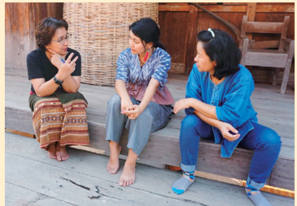
タイ・協力隊時代(職人との体験プログラムの打ち合わせ時写真)