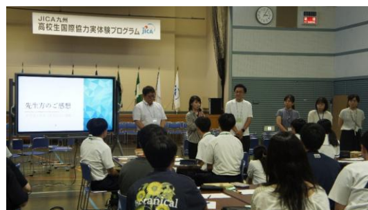
(先生からの感想発表)