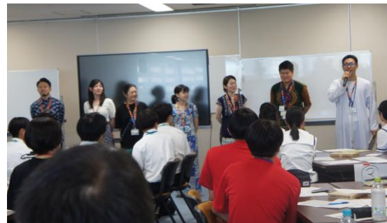
(国際協力推進員の自己紹介)