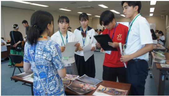
(フィールド調査の様子)