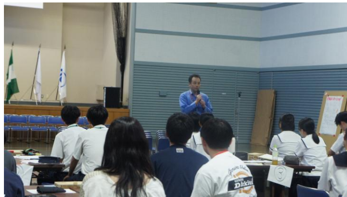
(山口次長による閉会挨拶)