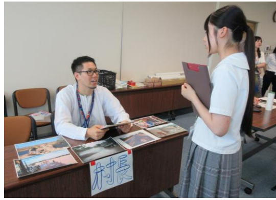
(フィールド調査の様子)