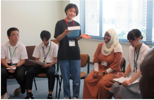
(生徒が JICA 研修員を紹介している様子)