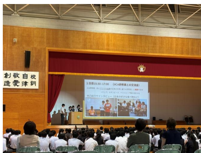
(文化祭での発表の様子②)