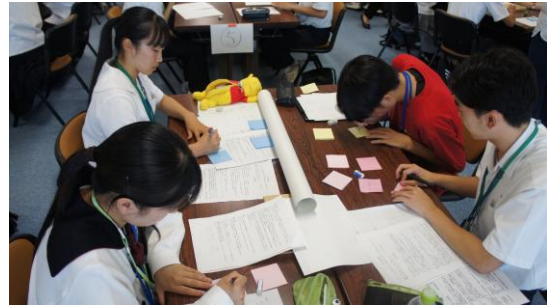
(活動計画策定の様子)