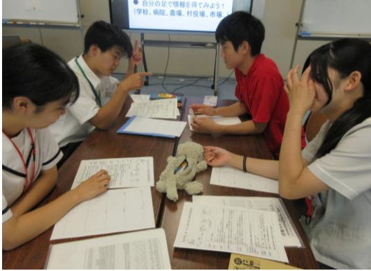
(「ポポ村の概要」を確認している様子)