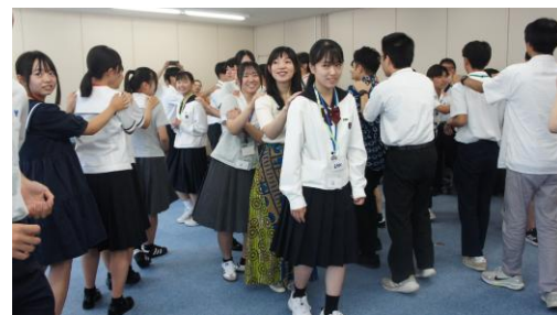
(アイスブレイクの様子②)