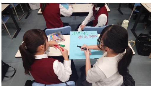
(活動計画を立てる様子)