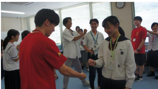
(アイスブレイクの様子①)