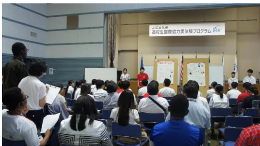
(JICA 研修員からのフィードバック)