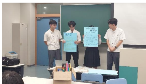
(活動計画発表の様子)