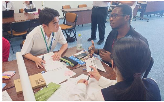
(JICA 研修員へインタビュー)