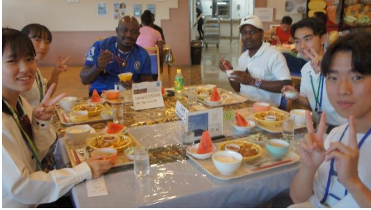
(夕食交流会のグループ①)