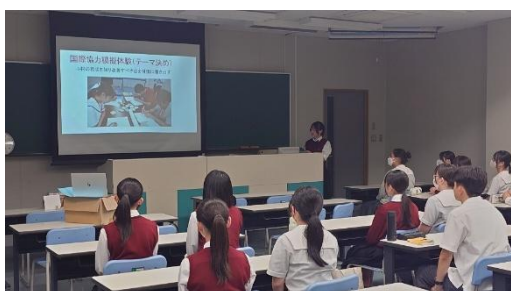
(プログラムの報告の様子)

参加した生徒3名から「高校生国際協力実体験プログラム」での参加体験を発表した。発表では、プログラムを通じて学んだ異文化理解に対する重要性や気づきを共有し、他の生徒たちにも国際理解への関心を持ってもらう取り組みとなった。IECの部員約20名に対して国際協力模擬体験のミニワークショップを実施した。5グループがそれぞれ食料、教育、経済、医療分野と様々なテーマで発表を行った。最後は福岡県国際協力推進員が講評を行い、IECの部員の異文化を体験する機会となった。