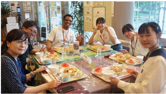
(夕食交流会のグループ③)