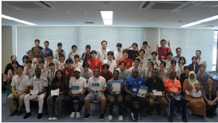
(JICA 研修員との集合写真)