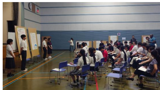
(JICA 研修員からのフィードバック)