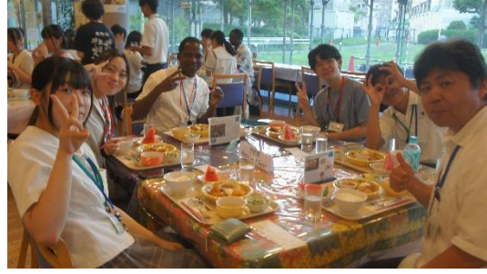
(夕食交流会のグループ②)