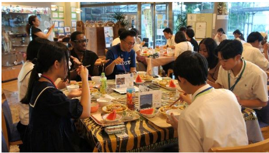
(食事を囲んでの交流)