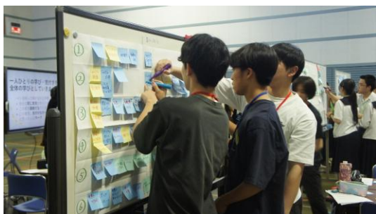
(全体共有の時間でマークを書く様子)