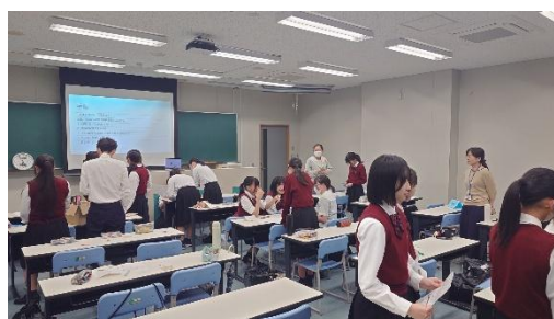
(ミニワークショップ)