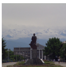
壮大な自然も魅力のひとつ