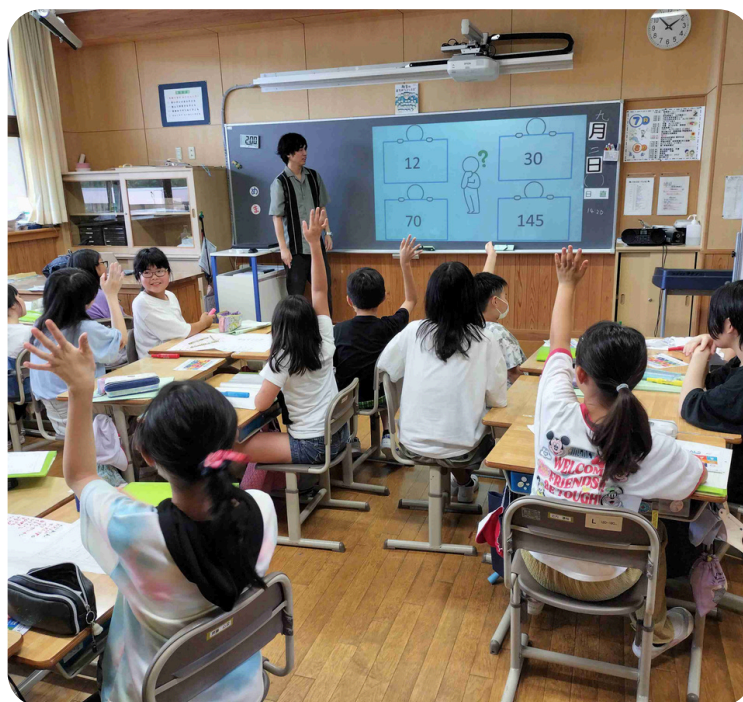
世界を知るクイズ