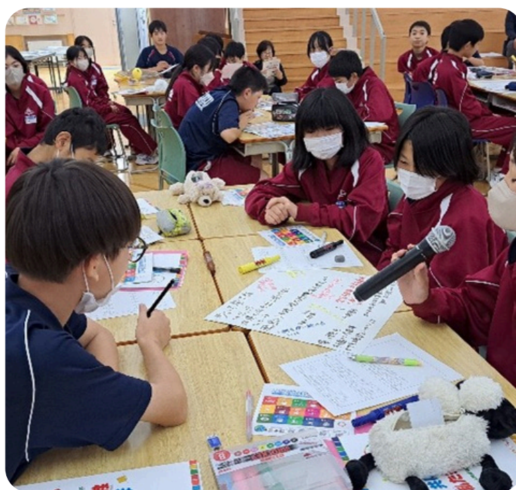
自分たちができるSDGs