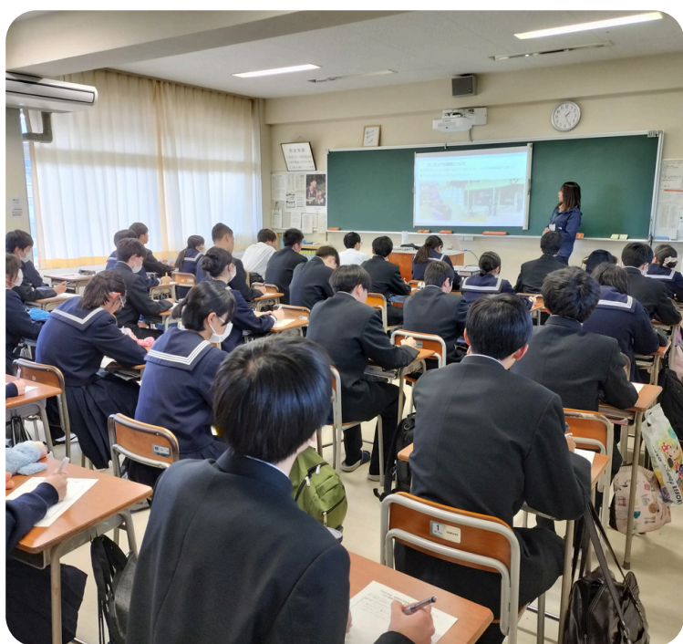
カンボジアでの体験談