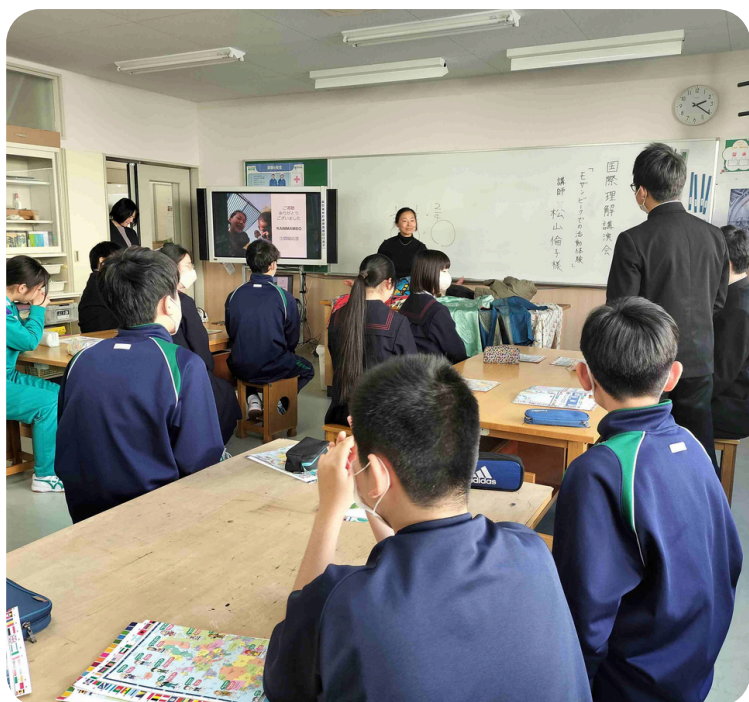
協力隊員に聞いてみよう