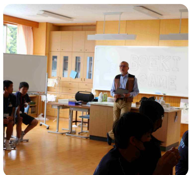
国際理解ワークショップ