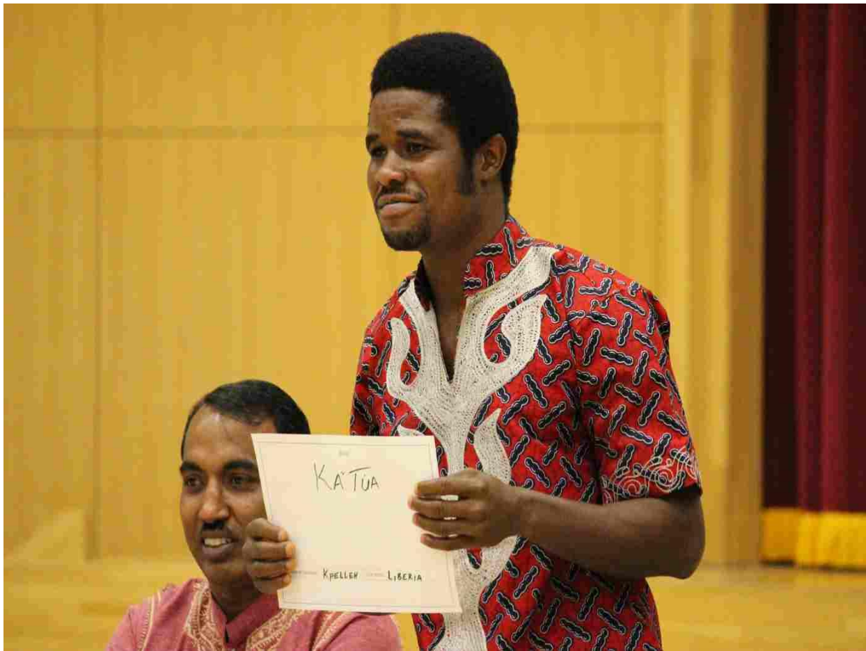
お互いの自己紹介