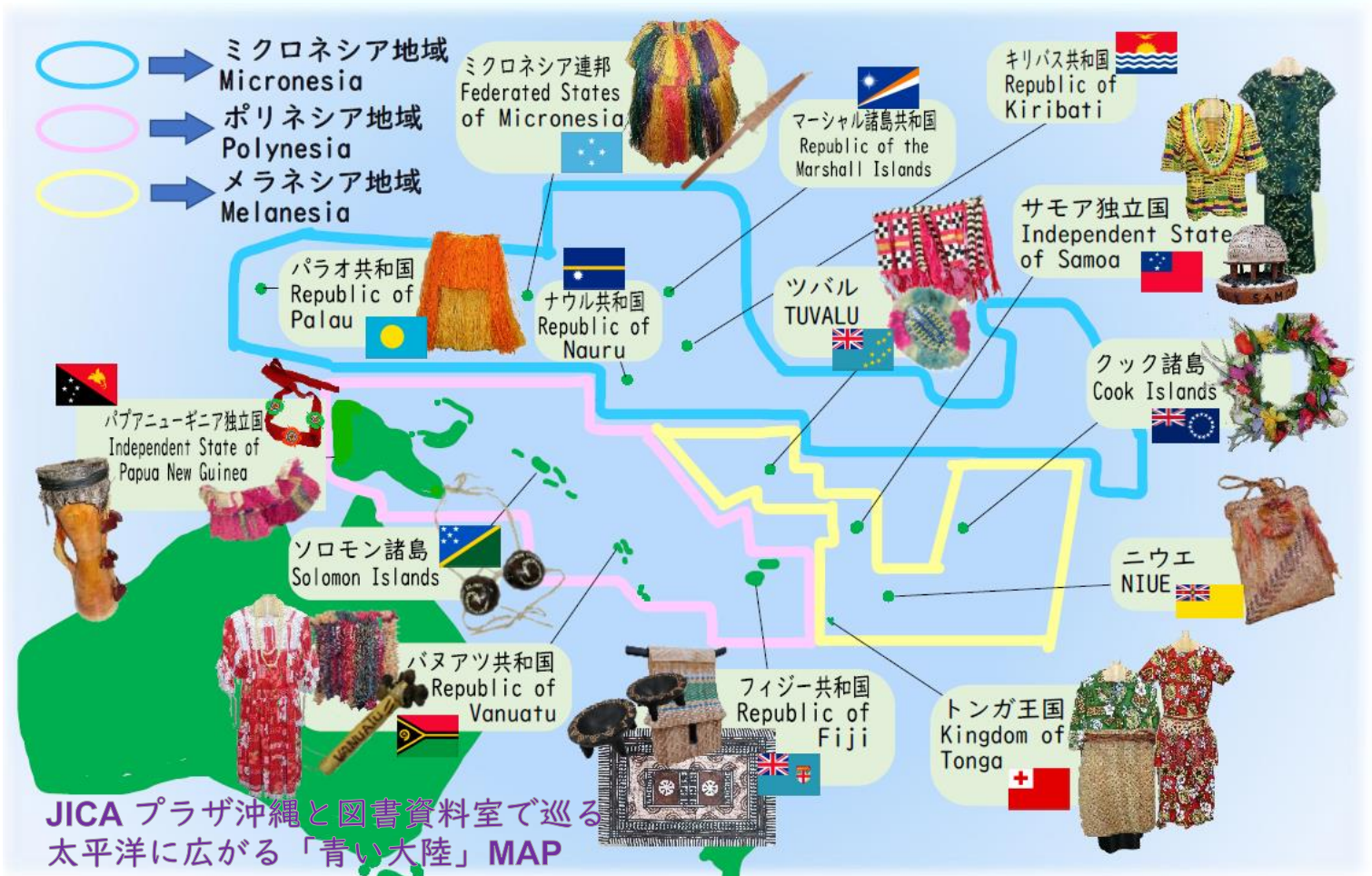
JICA プラザ沖縄と図書資料室で巡る 太平洋に広がる「青い大陸」MAP

太平洋に広がる 16 か国及び 2 地域の島々は太平洋島嶼国と言われ、太平洋島嶼国の人々は太平洋を「青い大陸」と呼んでいます。太平洋島嶼国の人々は親日的で、国際社会において日本の立場を支持ししてくれる重要なパートナーです。明治時代には日本から多くの移民が渡り、現在も日系の方々が多く暮らしています。ミクロネシア地域は歴史的背景もあり、日本の文化や言葉の名残が見られます。