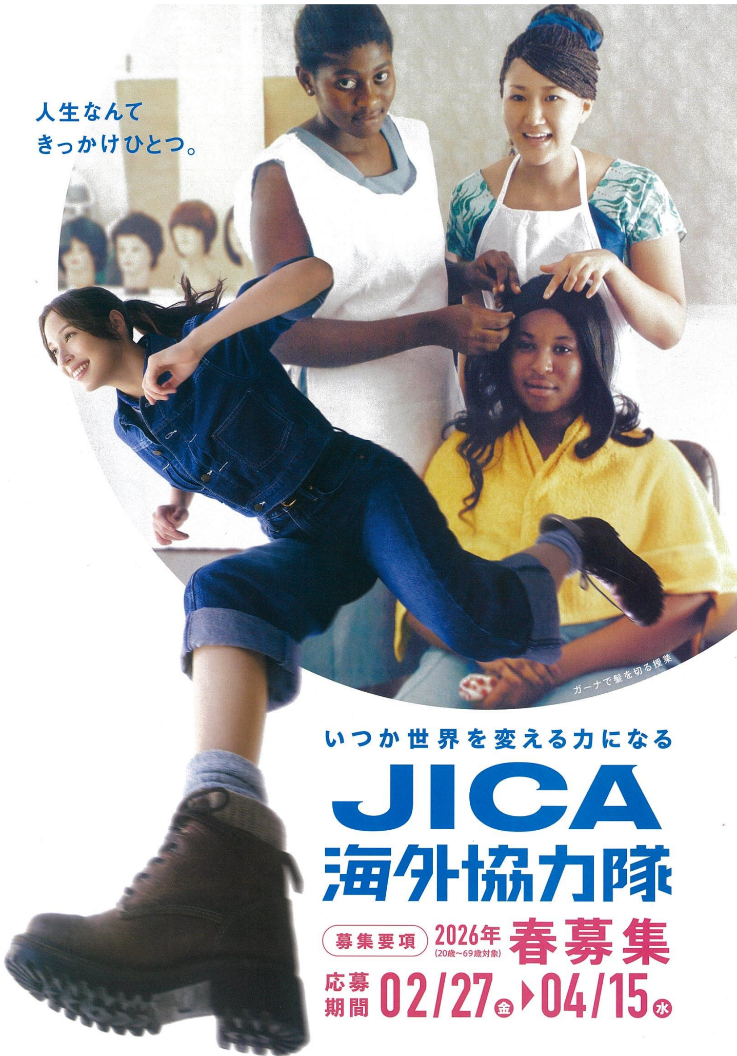
ガーナで髪を切る授業