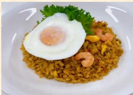
ナシゴレン ¥850 Indonesian fried rice