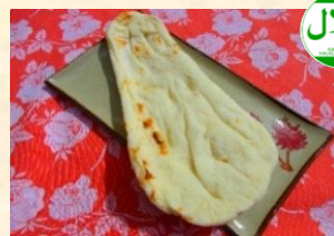
ナン ¥300 Naan