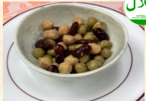
ミックスビーンズ ¥300 Mixed Beans