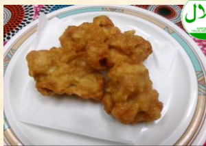
チキン唐揚げ ¥350 Fried Chicken

セットメニューには メニューにより ライス・スープ・サラダがつきます コーヒー(ホット・アイス) 単品¥200 お食事またはケーキとセットで ¥150