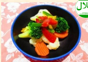
温野菜 ¥500 Hot Vegetables