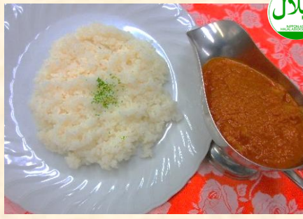
チキンカレー ¥850 Chicken Curry