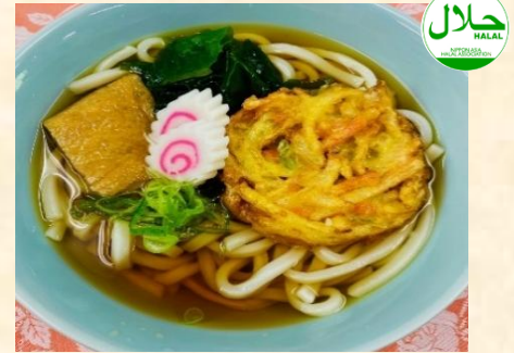
かき揚げうどん ¥850 Kakiage Udon

セットメニューには メニューにより ライス・スープ・サラダがつきます コーヒー(ホット・アイス) 単品¥200 お食事またはケーキとセットで ¥150