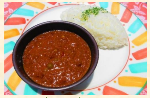
キーマカレー ¥850 Keema Curry