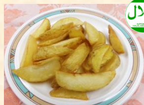
フライドポテト ¥250 French Fries