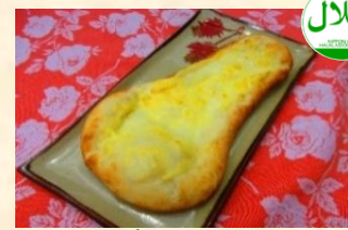
チーズナン ¥400 Cheese Naan