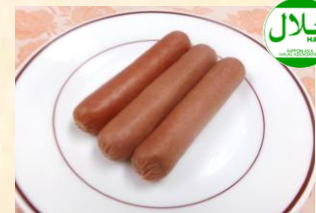
チキンウィンナー ¥350 Chicken Wiener