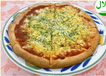
ピザ ¥850 Pizza