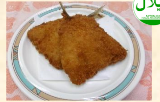
アジフライ ¥350 Fried Horse Mackerel