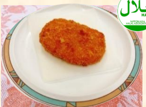
野菜コロッケ ¥150 Vegetable Croquette