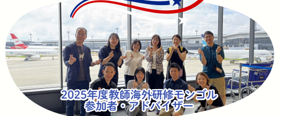
2025年度教師海外研修モニター参加者・アドバイザー