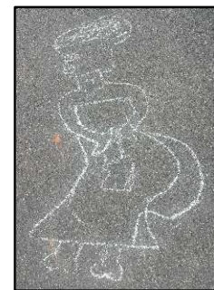
道中に描かれていた謎の絵