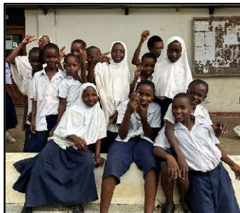
休み時間をバジャリ!