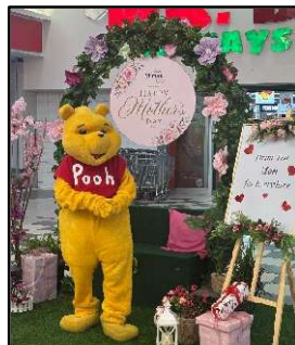
タンザニアでの母の日イベント!