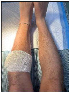
よく見たらかなりむくんです。