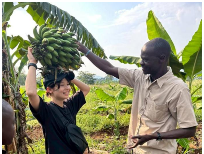
バナナの収穫体験