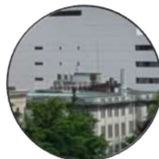
LARA 物資を保管した倉庫

LARAの碑の前では、香淳皇后の御詩に触れながら、ララ物資についての解説が行われ、戦後の厳しい状況下で日本を支援しようと尽力した日系人の存在について学びました。