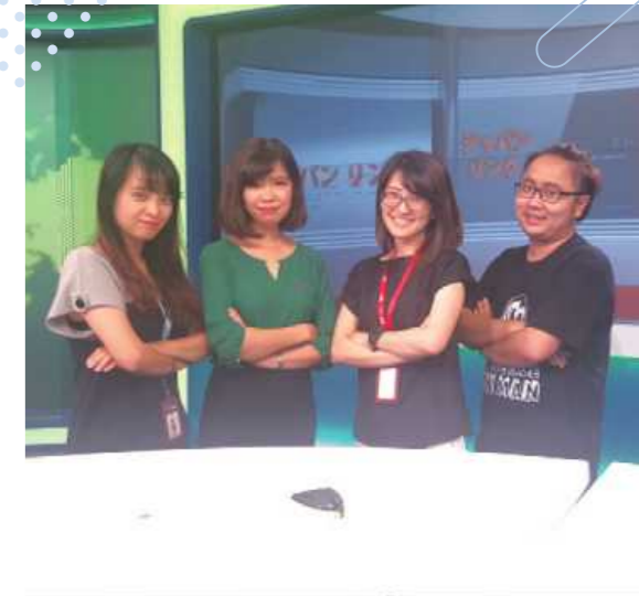
ベトナム初の日本語番組チーム

言葉や文化の壁があっても、相手の背景を理解し、信頼関係を築く力。それはJICA海外協力隊活動で得た最大の財産であり、ベトナムと神奈川県をつなぐ今の仕事の、大きな原動力となっています。