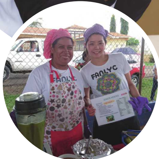
現地にて食育巡回活動の様子

国際貢献への関心と栄養士の職種枠があることを知りJICA海外協力隊に応募。2017年から2年間パナマに赴任し、現地NGOで栄養士として活動。現場の調理師と協働し、食文化の壁を乗り越えて子どもたちの栄養改善に貢献した。帰国後、活動で不足を感じた栄養状態の調査方法や公衆衛生学を学ぶため大学院に進学。現在は神奈川県内の内科クリニックで管理栄養士として、糖尿病や高血圧症などの非感染性疾患の患者への栄養相談に従事している。