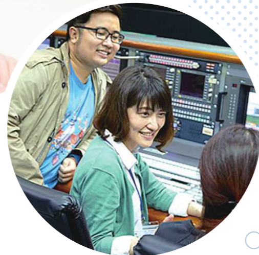
ベトナム国営のテレビ局にて

30歳を迎え、自身のキャリアと向き合っていた時期に友人の影響で協力隊に関心を持つ。番組制作の経験を活かせる職種があることを知り応募。2年間ベトナムに赴任し、テレビ局で番組制作支援やアナウンス指導を行う。帰国後、神奈川県庁に入庁。現在はベトナムとの交流事業等に携わっている。