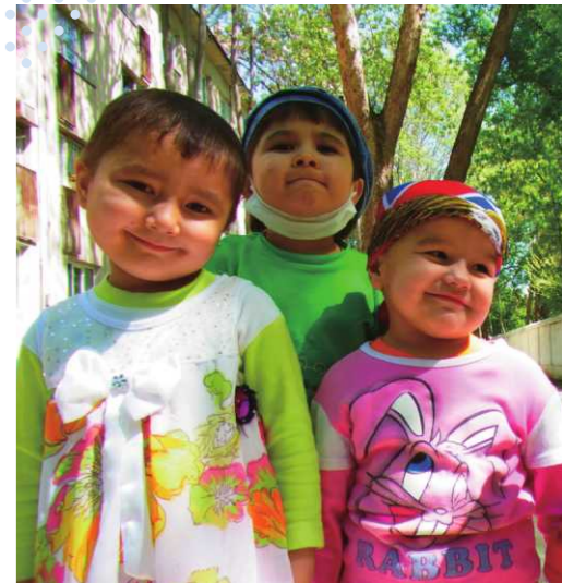
小児病院の子どもたち

今後の目標は、ヘアメイクや衣装も含めた体験を提供できるバリアフリーなスタジオを作ること。障がいがあっても、おしゃれをして特別な時間を過ごせる。そんな思い出作りの場を実現したいと考えています。帰国後、神奈川県を拠点に日本の子供たちを撮影と支援の両面で照らすことができるような活動をできればと考えています。