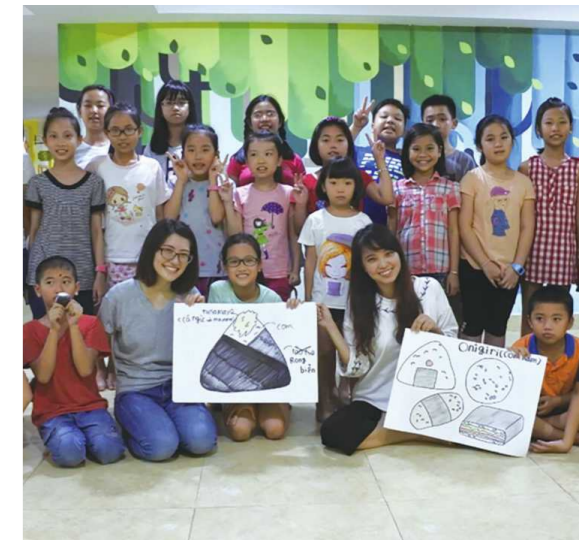
業務外で子どもたちに日本文化を紹介