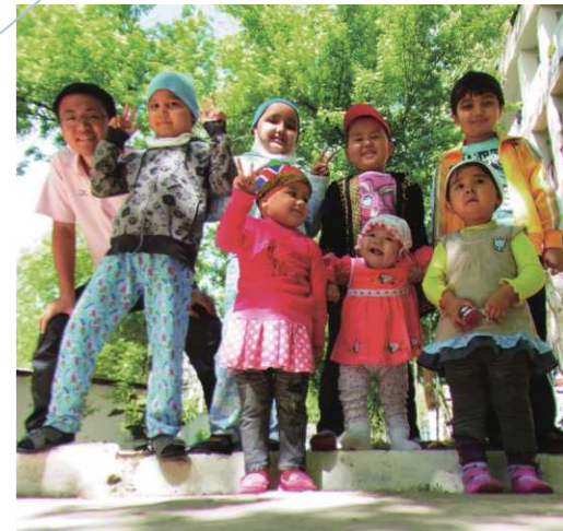
現地の子どもたちと