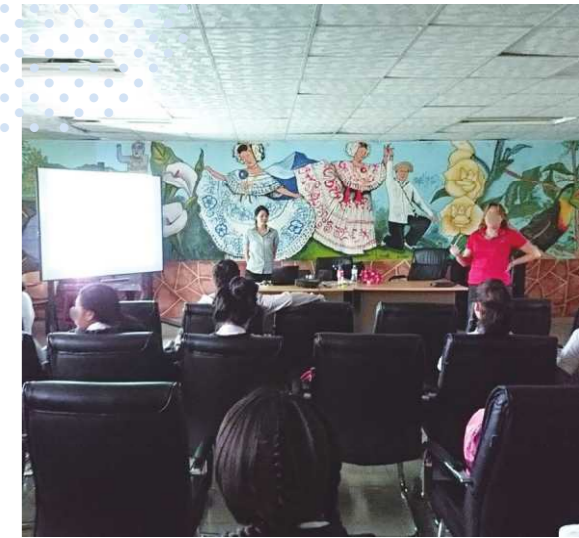
中学校で行った栄養授業

赴任当初はがんや白血病などの病状を抱える施設の子もたちへのレシピ開発から始まった活動ですが、現地のニーズに合わせてその幅は急速に広がっていきました。治療と向き合う施設の子もたちの保護者への食事アドバイスや栄養セミナーの定期開催、各地の小中学生への食育活動、さらには農村地や企業で働く方を対象に地元の野菜を活用した栄養セミナーまで。パナマの多様な地域で幅広い年齢層の人々の健康を「食」から支える日々に関与しました。