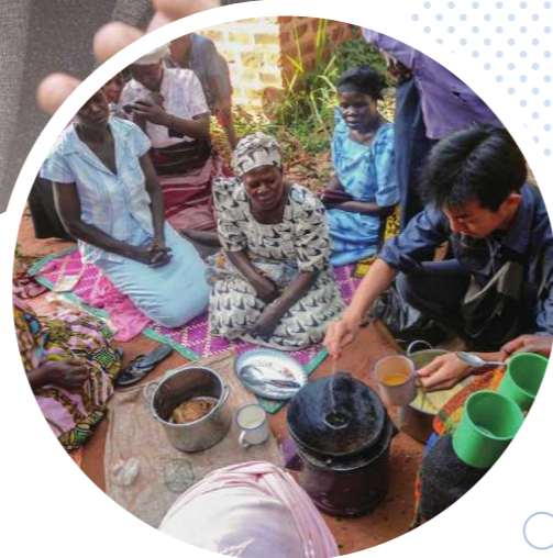
現地にて加工食品販売の活動の様子

横浜市出身。関西学院大学法学部政治学科(国際政治専攻)卒業後、JICA海外協力隊へ応募。2014年7月から2016年7月まで、ウガンダ共和国ブイクエ県ニエンガ村にコミュニティ開発隊員として赴任。帰国後、民間企業勤務を経てフリーランスのフォトグラファー・映像作家として独立。2023年に株式会社NeBonga(ネボンガ)を設立し、ウガンダでの現地法人設立など日本とアフリカを繋ぐ事業を展開している。