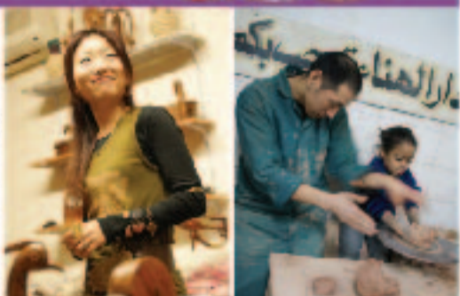
مماساكي إنكيما حراف شياكي جوتو سمنسلة

"كل لواء العلم التي نستخدمها من الغرة لمصرية، وترتبط كل المتابعين بالهويت الثقلي". وقد اختتمت شياكي كلامها بالقول: "بعد تلك السيدات اللاتي يصنعن هذه المنتجات، وبعد بناء علاقة متداولة معهن، أصبحت أكثر حاسة ووعية في بيع منتجاتهن. أصبح الأمر شخصياً بالنسبة لي".