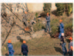
تدريب العمال المصريين بالشركة اليابانية لكهرباء مصر

نارو: الخطة الرئيسية ليس لها أي هدف سياسي. على الرغم من أن السياسة والاقتصاد مرتبطين ارتباطاً وثيقاً إلا أنهما قضيتان منفصلتان. فنحن نحاول أن نحسن من أوضاع البلاد من الناحية الاقتصادية والإجتماعية. وإذا نجحنا في توفير حياة أفضل للناس، فإنهم سيظهرون بالرحا وسوف تقلل الخطة من عدم الاستقرار؛ و لأمر سيستغرق بعض الوقت. فطبي سبيل للثبات استغرق إندونيسيا ست سنوات ونصف السنة لاستعادة اقتصادها بعد سقوط الديكتاتور سومباردو في عام ١٩٩٨. لقد عانوا كثيراً، بيد أن الناس تحلوا بالصبر. وهلمني إندونيسيا الآن واحدة من أقوى الاقتصادات الناشئة في آسيا.