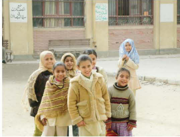
School children at one of the participating schools in the health promotion project