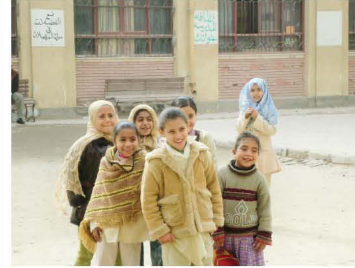
أطفال المدارس في واحدة من المدارس المشاركة في مشروع تعزيز الصحة