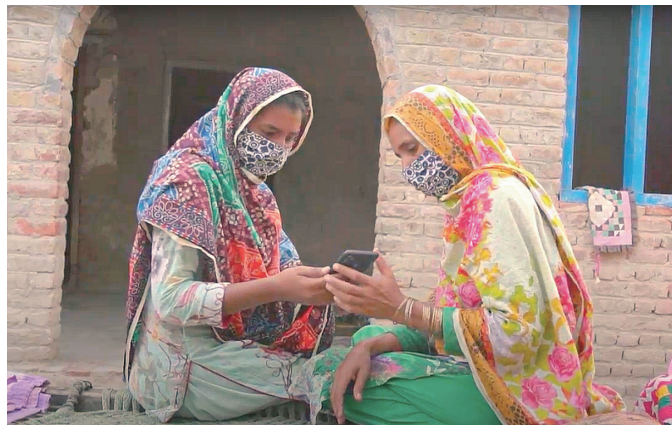
Des femmes commercialisent des produits artisanaux avec leurs smartphones.

Dans la province de Sindh, au Pakistan, de nombreuses «travailleuses invisibles» fabriquent chez elles des objets artisanaux et d'autres produits qu'elles vendent pour générer des revenus. Cependant, de nombreux marchés ont été fermés en raison de la pandémie de COVID-19 en 2020. En réponse, la JICA a organisé des formations sur le marketing numérique et l'utilisation des réseaux sociaux afin de permettre aux travailleuses de vendre leurs produits en ligne et de maintenir leur autonomie économique.