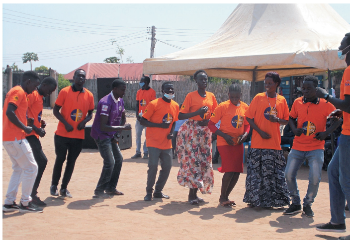
Commémoration de la Journée internationale pour l'élimination de la violence à l'égard des femmes le 25 novembre.