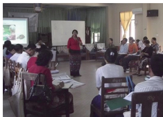
Participants à un programme de formation au Myanmar.