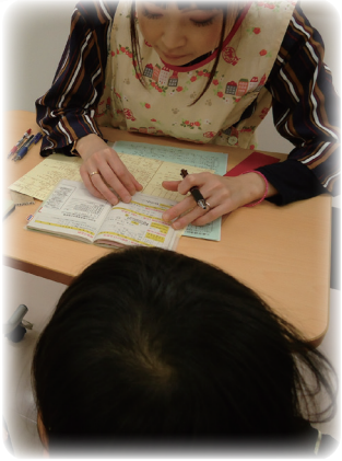
Seorang perawat kesehatan masyarakat mencatat data kesehatan anak di Buku KIA saat pemeriksaan usia 3 tahun

pertumbuhan anak yang direvisi secara desentralisasi. Perhatikan bahwa konsep dasar dan struktur Buku KIA masih tidak berubah, yaitu (i) pencatatan data KIA yang ramah-pengguna dan terstandarisasi, (ii) panduan tentang KIA, dan (iii) jumlah minimum halaman dan desain berukuran praktis sebagai catatan kesehatan portabel.