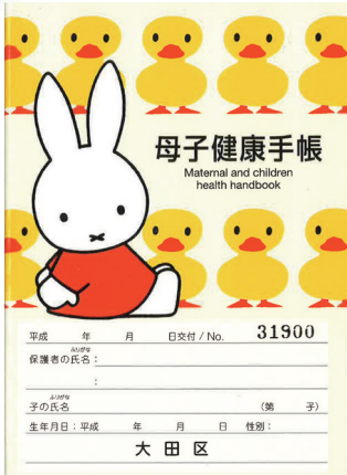
Buku Kesehatan Ibu dan Anak, Ota city, Tokyo