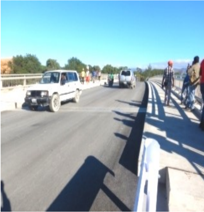
L'ouverture du pont de la route neuve au trafic après son inauguration