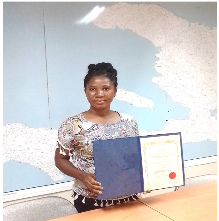
Une participante du stage de formation "Méthodes d'Enseignement des Mathématiques au Primaire pour l'Amélioration de l'Apprentissage"

La JICA espère que les bénéficiaires du programme de formation PCCC feront de leur mieux pour appliquer et utiliser les nouvelles connaissances et techniques apprises au champs de leur travail, et également pour partager et restituer aux secteurs concernés ces connaissances pour l'amélioration et le développement desdits secteurs.