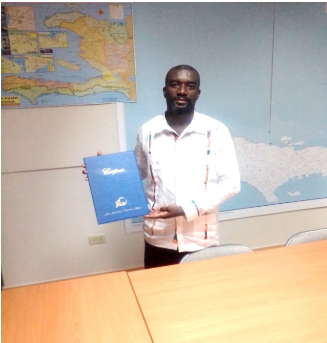
Un participant du stage de formation "Méthode d'Enseignement des Mathématiques au Primaire pour l'Amélioration de l'Apprentissage".

Site : https://www.jica.go.jp/french/index.html