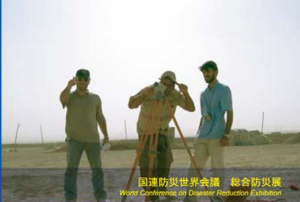
国連防災世界会議 総合防災展 World Conference on Disaster Reduction Exhibition

JICA's Assistance in Disaster Management ~ The Japanese Assistance for Reconstruction of Bam Earthquake in the Islamic Republic of Iran ~