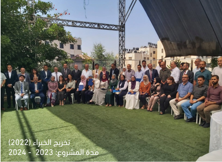
تخريج الخبراء (2022) مدة المشروع: 2023 - 2024