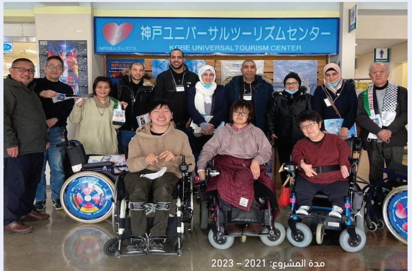
مدة المشروع: 2021 - 2023

يتضمن المشروع دورات تدريبية متتالية في اليابان لتعزيز التنمية السياحية في فلسطين من خلال إدخال مفهوم جديد لقطاع السياحة الفلسطيني في السياسة السياحية. سيؤدي ذلك إلى جذب سؤاح جدد لديهم عوائق أمام السفر، مثل كبار السن وذوي الإعاقة، مما سيؤدي في النهاية إلى تعزيز السياحة في فلسطين.