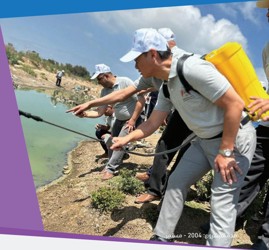
قناة المشروع: 2004 - مستمر

تأسست رابطة خريجي جايقا في فلسطين عام 2004 من قبل مشاركين سابقين في دورات جايقا التدريبية في اليابان أو دولة ثالثة (مشاركين سابقين في جايقا) بهدف الحفاظ على علاقة قوية مع اليابان وتعزيز العلاقات الجيدة بين المشاركين في تدريب جايقا السابقين. يسعى الخريجون إلى تعزيز نشر المعرفة ونقل المعرفة الفنية من الأعضاء لدعم التنمية في المجتمع من خلال تنظيم الأنشطة المجتمعية بهدف تبادل المعلومات ذات المنفعة المتبادلة.