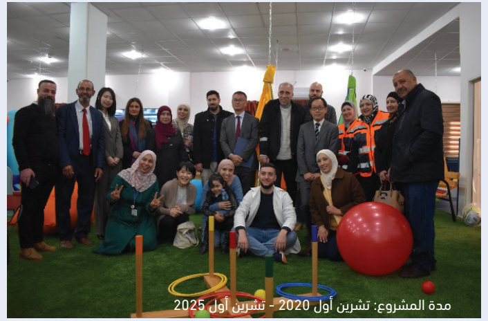
افتتاح الحديقة الحسيّة للأطفال ذوي الإعاقة في مخيم الجلزون في رام الله مدة المشروع: تشرين أول 2020 - تشرين أول 2025