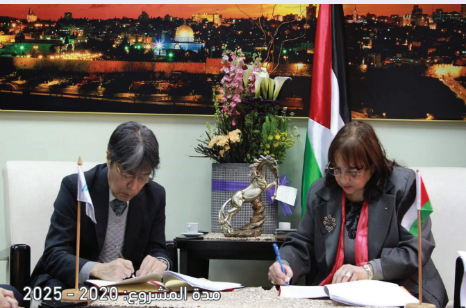
مدة المشروع: 2020 - 2025

شراء المعدات الطبية لمرافق وزارة الصحة المتعلقة بمعالجة اللقاحات وإدارة سلسلة التبريد.