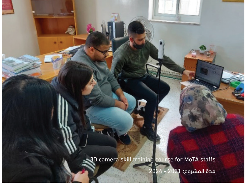
3D camera skill training course for MoTA staffs