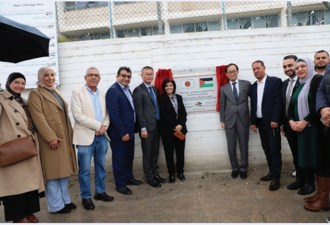
افتتاح مشروع إعادة تأهيل شبكة الطرق الداخلية في مخيم عقبة جبر في أريحا

الهدف هو تحسين بيئة مخيمات اللاجئين من خلال تسريع تخطيط وتنفيذ خطة تحسين المخيمات من خلال تقديم المنحة، وتحسين الظروف المعيشية لسكان مخيمات اللاجئين في الضفة الغربية من خلال تنفيذ مشاريع حيوية في البنية التحتية.