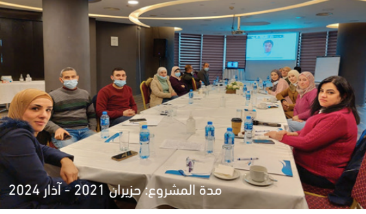
مدة المشروع: حزيران 2021 - آذار 2024