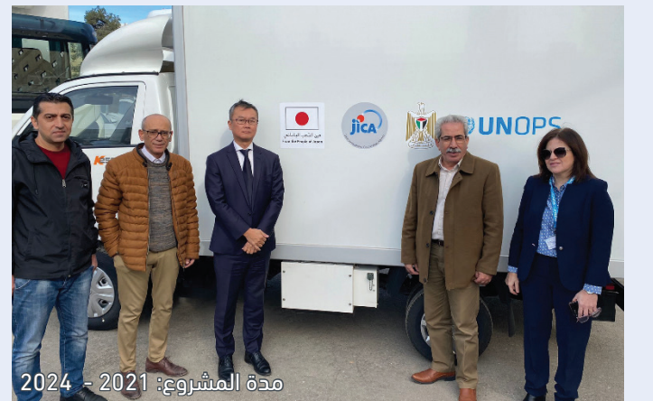
مدة المشروع: 2021 - 2024