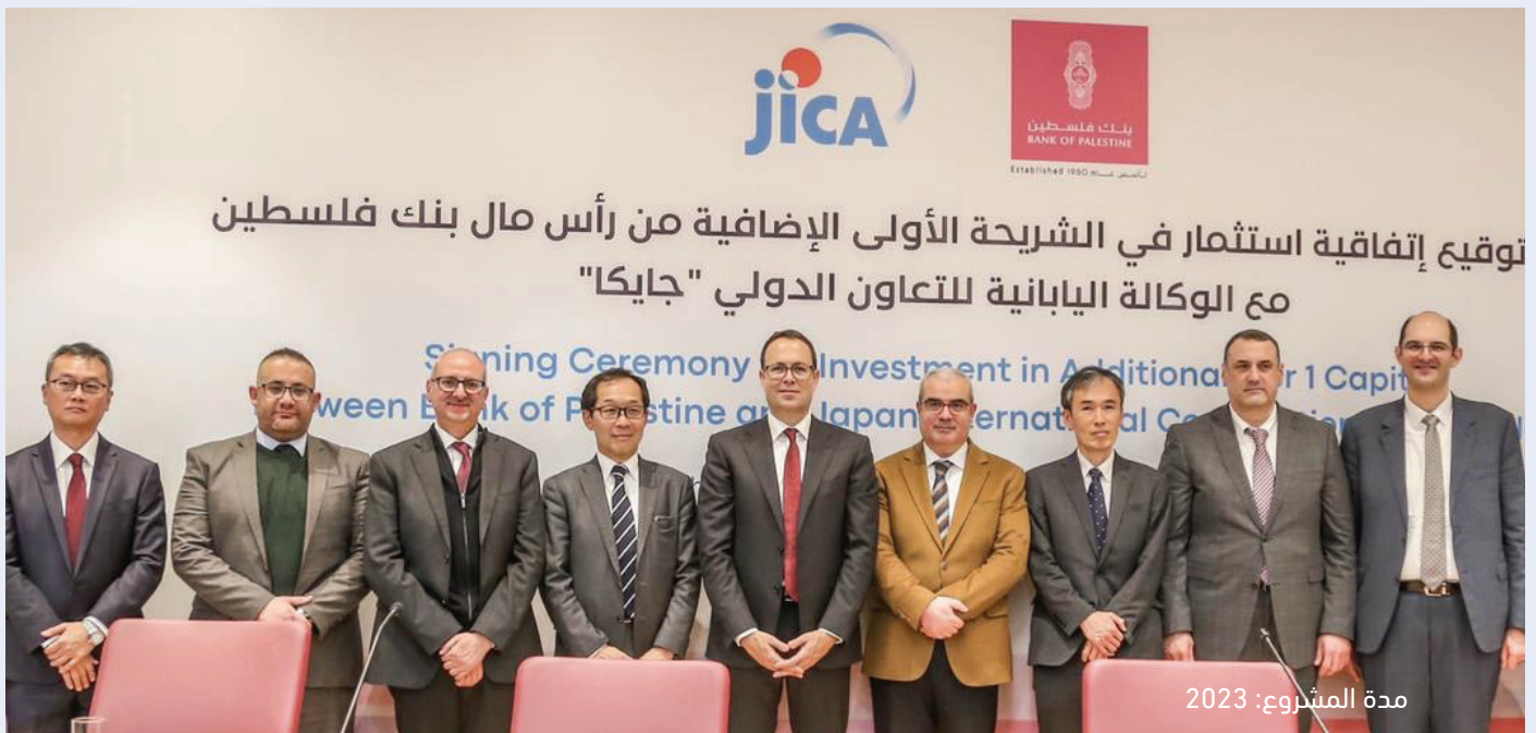
مدة المشروع: 2023

وقعت جايكا وبنك فلسطين اتفاقية قرض بقيمة 30 مليون دولار أمريكي لاستثمار إضافي من المستوى الأول في رأس مال البنك. وتهدف اتفاقية القرض هذه إلى تعزيز رأس مال البنك لغرض إقراض المشروعات متناهية الصغر والصغيرة والمتوسطة في فلسطين. وهذه الأداة الأولى من نوعها التي يتم تقديمها في فلسطين.