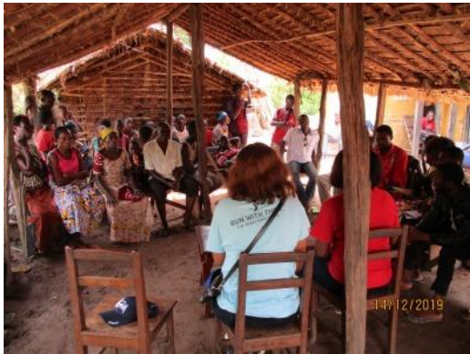
Session d'informations sur le Projet