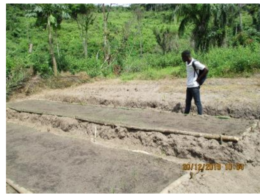
Préparation des pépinières villageoises