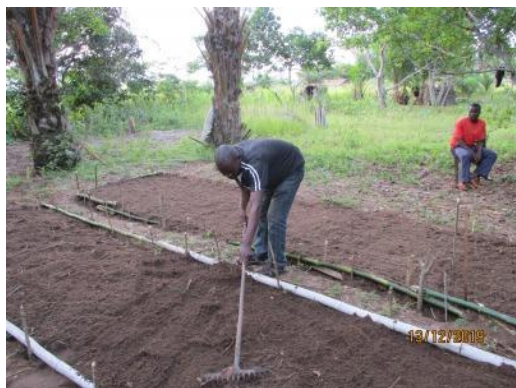
Préparation des pépinières villageoises