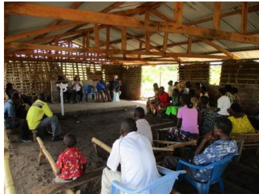
Session d'informations sur le Projet