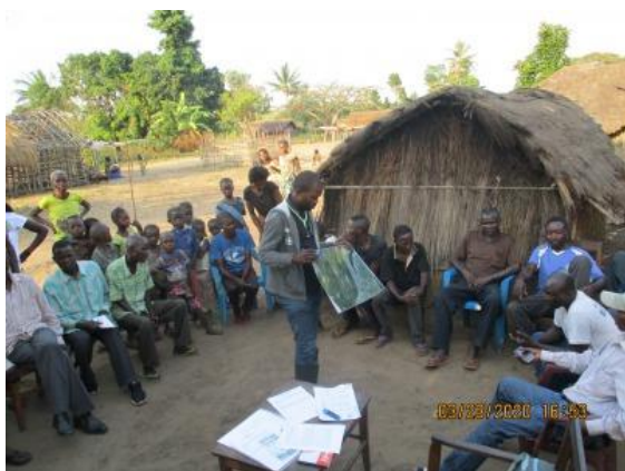
Explication dans un atelier de travail participatif

A travers des ateliers de travail participatifs au niveau communautaire, les villageois de chaque village eux-mêmes analysent l'évolution des ressources naturelles, la répartition des terres agricoles et les problèmes des villages, etc., pour formuler le Plan Simple de Gestion des Ressources Naturelles y compris les activités de conservation des forêts restantes et celles de protection des forêts régénérées.