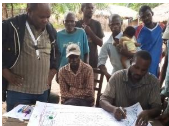
Préparation de la carte (Cartographie) des forêts restantes et régénérées à protéger