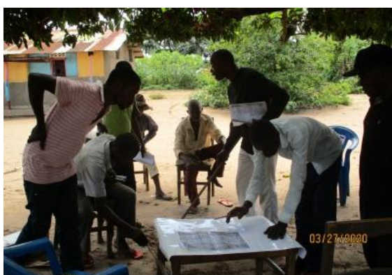
Discussions pour la préparation de la carte (Cartographie)