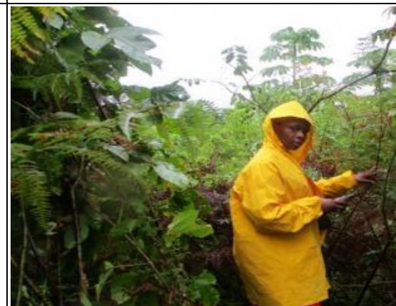
Prélèvement des Coordonnées géographiques de la culture et régénérations des cultures abandonnées (RCA)