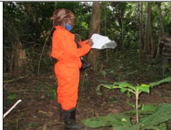
Prise de note sur l'information de la forêt secondaire (forêt à Hévéea)