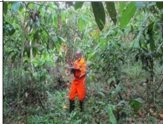
Prise de note sur la fiche terrain dans la plantation des Cacaos