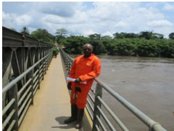
Traversée de la rivière LINDI, en pleine mission d'identification et de localisation des quelques couches d'occupation du sol dans la Province de la Tshopo