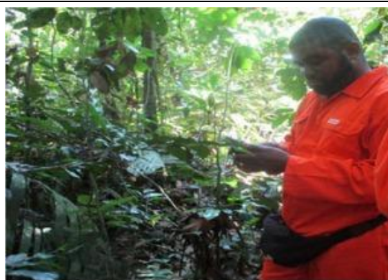
Prélèvement des coordonnées géographiques, en Forêt secondaire