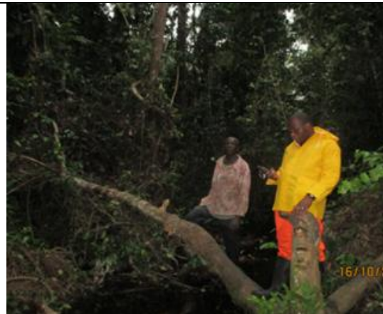
Prise des coordonnées géographiques dans une forêt dense sur terre ferme dans la province de la Tshopo