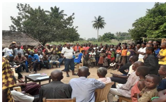
Séance d'information sur le Projet dans le village de MATANA KIMBUMBA