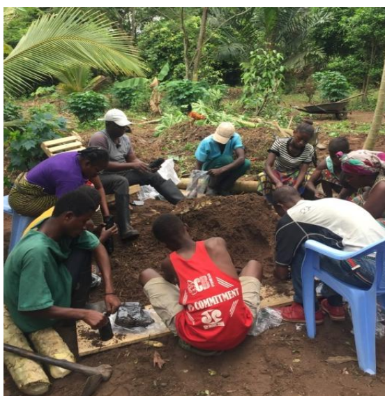
Mise du sol dans un pot de plant