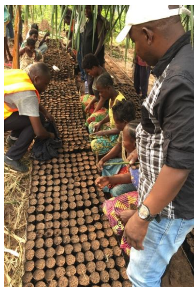
Ensemencement dans un pot de plant