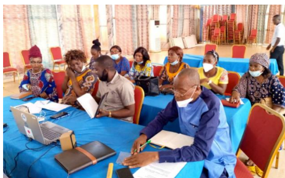
Salle de Bandundu