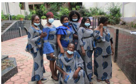
Membres féminins du personnel du Projet