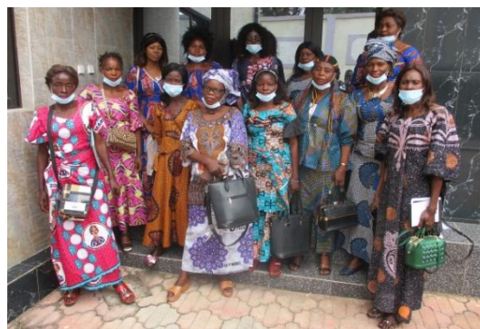
Participants de la salle de Kikwit