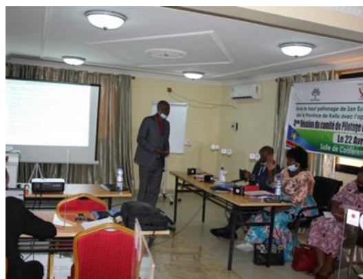
Réunion sur place du CoPIL