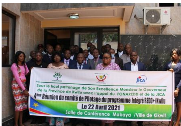
Membres du CoPIL

Un article relatif à la réunion ayant eu lieu en cette journée a paru dans la presse locale (Infos24.net) de la RDC.