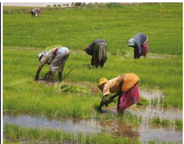
Des agriculteurs retirent les plants de riz (Tanzanie).