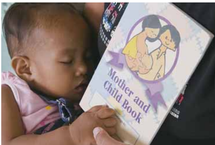
Un enfant dans les bras de sa mère tient un guide sur la santé maternelle et infantile (Philippines)

Afin de rendre la coopération au développement plus efficace, la JICA favorise la coopération Sud-Sud et la coopération triangulaire, tout en examinant les possibilités de partenariats plus étroits avec les ONG et les entreprises.