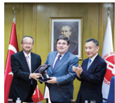
Cérémonie de signature de l'accord de prêt d'APD pour le projet de réhabilitation du bassin versant du fleuve Coruh (juin 2011).

En raison d'une croissance économique exceptionnelle, la Turquie a des besoins urgents en matière d'amélioration environnementale et de développement des ressources humaines, et la JICA contribue à répondre à ces besoins à travers des prêts d'APD et la coopération technique. La Turquie étant comme le Japon un pays à forte sismicité, la JICA assure également une coopération technique comprenant une formation au Japon pour la préparation aux catastrophes sur le long terme. En janvier 2012, la JICA a signé un protocole d'accord avec l'Agence turque de coopération et de coordination (TIKA), afin de promouvoir des projets conjoints. En coopération avec la Turquie, des projets de coopération technique ont commencé en Asie centrale et au Moyen-Orient.