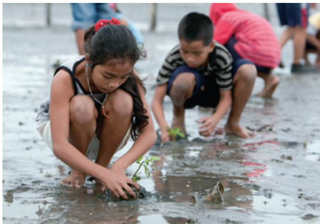
Des enfants plantent des semis de mangroves (Philippines : projet d'amélioration de la qualité de vie par le reboisement des forêts de mangroves sur l'île de Negros).

Fort de ses propres expériences en matière de modernisation, de reconstruction après-guerre et de coopération avec les pays d'Asie, le Japon sait que l'appropriation des pays en développement est l'élément clé de leur essor et qu'une croissance continue et inclusive est essentielle pour en pérenniser les résultats, notamment la