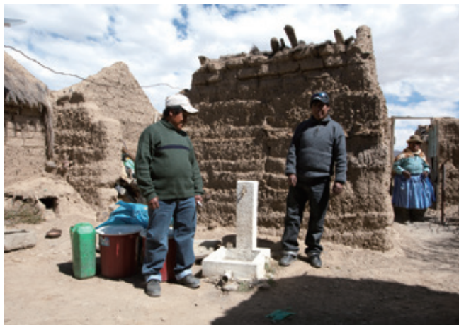
Canalisations reliant un réservoir d'eau aux maisons de la communauté (Bolivie : projet « L'eau est la santé et la vie »).

Afin de rendre la coopération au développement plus efficace, la JICA favorise la coopération Sud-Sud et triangulaire, tout en examinant les possibilités de partenariats plus étroits avec les ONG et le secteur privé.