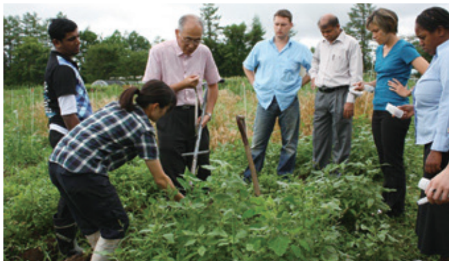
JICA Hokkaido (antenne d'Obihiro) : Formation pour une agriculture respectueuse de l'environnement en utilisant les caractéristiques d'Obihiro comme base de production agricole (Programme de formation et de dialogue international : Une agriculture respectueuse de l'environnement pour une augmentation de la production alimentaire)