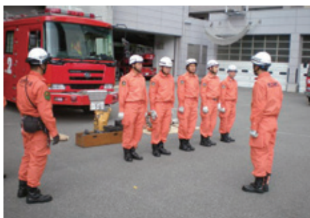
JICA Tokyo : Formation sur les techniques de lutte contre les incendies par le partage des compétences japonaises en matière d'activités de lutte contre les incendies et de sauvetage applicables aux pays en développement. (Programme régional de formation et de dialogue : Formation sur les techniques de lutte contre les incendies - Vietnam)

Le programme de formation et de dialogue est l'un des programmes de formation technique réalisés au Japon, au cours duquel des formations en groupe sont dispensées à des participants