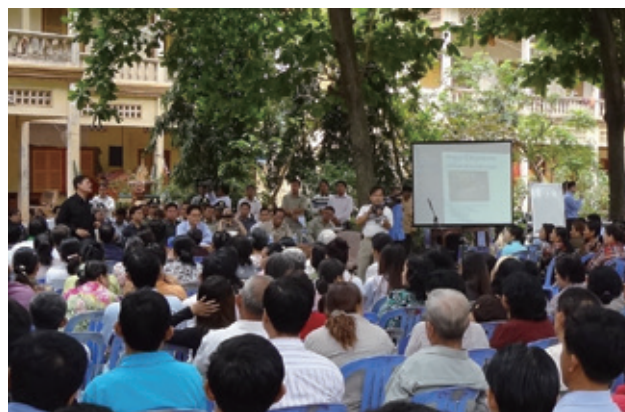
Réunion entre les parties prenantes au projet d'amélioration de la route nationale N°1 au Cambodge

Les documents exposant les procédures d'opposition et les rapports annuels des examinateurs sont disponibles à la page « Procédures d'opposition » sur le site internet de la JICA : http://www.jica.go.jp/english/operations/social_environmental/objection/index.html (en anglais) Aucune objection n'a été reçue au cours de l'exercice 2011.