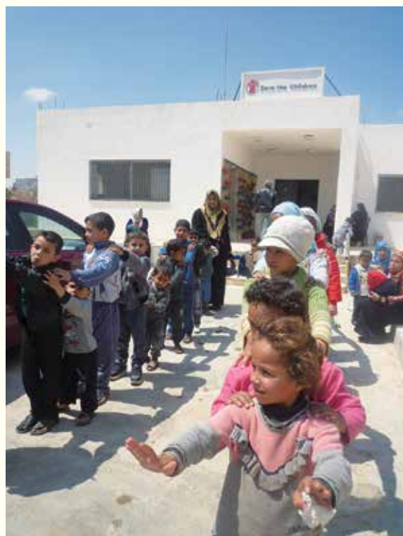
Des enfants réfugiés syriens font la queue (le bâtiment « Save the Children » est à l'arrière plan).

Dans cette optique, l'aide de la JICA apporte, au-delà de l'aide matérielle, un soutien humain. La JICA redouble d'efforts pour apporter une aide globale, à l'intérieur et en dehors des camps, et répondant à des besoins urgents et à plus long terme.