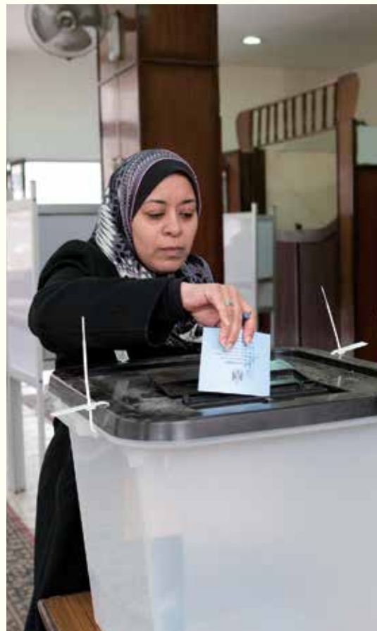
Une femme dépose son bulletin dans l'urne d'un bureau de vote pour les élections présidentielles.

À l'issue de ce processus, l'Égypte a établi le « Cadre stratégique du plan de développement économique et social jusqu'en 2022 ». La JICA a l'intention d'intensifier son aide pour la construction de systèmes afin de formuler et de mettre en œuvre les plans d'exécution basés sur ce cadre.