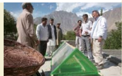
Un prototype de dessiccateur d'abricots fabriqué avec des matériaux locaux. Des améliorations sont apportées à ce modèle pour permettre aux agriculteurs de produire des abricots secs, propres et beaux, en peu de temps dans leur jardin.

Les résultats concrets de cette coopération sont visibles les uns après les autres, et se traduisent par des augmentations de revenus pour les agriculteurs. Les ventes tests de pommes dont le processus de sélection et d'emballage a été amélioré ont permis de quasiment doubler les prix sur les marchés de fruits et légumes d'Islamabad. Par ailleurs, les abricots séchés préparés avec des méthodes de récolte et de transformation