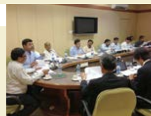
Une réunion du Comité de surveillance du programme de promotion des investissements dans l'État du Tamil Nadu.

C'est dans ce contexte que la JICA a signé en novembre 2013 un accord de prêt d'APD avec le gouvernement indien pour le programme de promotion