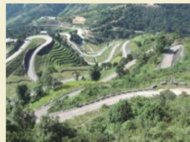
La seconde section de la route de Sindhuli serpente sur le versant pentu de la montagne. La technologie japonaise, un pays dont les reliefs sont similaires à ceux du Népal, a joué un rôle décisif.

Après ce projet de construction, un nouveau projet de promotion de l'agriculture commerciale sera bientôt lancé ; il permettra d'augmenter les revenus des personnes vivant le long de la route, et nous espérons ainsi leur redonner le sourire.