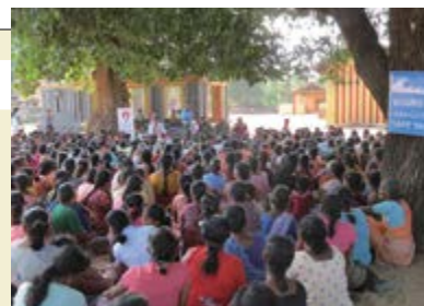
Formation aux évacuations en cas de tsunami menée dans le cadre du projet.

Les connaissances et expériences du Japon en matière de gestion des catastrophes ont été utilisées afin de préparer les mesures de prévention