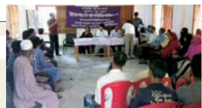
Formation d'un groupe communautaire dans l'hôpital d'un upazila (sous-district) du district de Munshiganj.

Le gouvernement du Bangladesh a fortement apprécié ces efforts dont il a fait un exemple : le modèle de Narsingdi. Le gouvernement a inscrit le soutien communautaire et la gestion totale de la qualité (GTQ) dans les installations médicales dans un programme national et prévoit une diffusion dans tout le pays. La