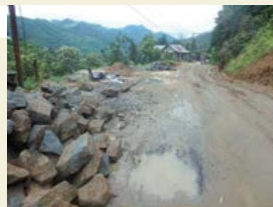
Une route nationale d'un État du nord-est endommagée par des pluies importantes.

Le Japon a été sollicité pour moderniser 1 200 kilomètres de routes nationales dans la région et il mène actuellement l'étude préparatoire du