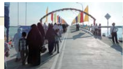
Le pont de Manmunai, achevé en avril 2014. De nombreux habitants assistaient à la cérémonie d'ouverture.

Le prêt d'APD en appui au projet de développement des infrastructures en faveur des pauvres des régions orientales a permis, par exemple, la stabilité de transport de l'abondante production agricole de la région vers les grands marchés par des initiatives telles que la restauration de près de 100 kilomètres de route nationale, le principal axe routier dans la province. Simultanément, le projet de construction du pont de Manmunai financé par un don, a permis de relier 24 heures sur 24 le continent et la zone côtière séparés par