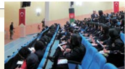
Les officiers de police femmes ont activement participé à l'atelier.

Malgré leur scepticisme avant la formation, les spécialistes ont été surpris par l'implication et la prise de parole des participantes. Ces dernières ont notamment déclaré : « En tant qu'officier de police, j'aimerais venir en aide aux femmes victimes de violences » et « J'espère pouvoir m'entretenir avec