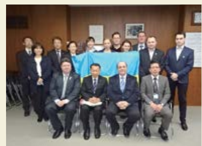
Visite au maire de Miyazu, dans la préfecture de Kyoto.

Le programme de formation aux pratiques commerciales centré sur la conservation énergétique a été organisé durant approximativement deux semaines en mars 2015. Un total de dix participants, chefs de gouvernements locaux, responsables administratifs et employés du secteur privé, tous concernés par la promotion de la conservation énergétique, ont suivi la formation. La formation comprenait des cours sur la politique énergétique du Japon et les mesures de conservation d'énergie