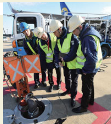
Formation pour le développement des ressources humaines à l'aéroport de Narita, destinée au personnel chargé de l'exploitation de l'aéroport international d'Oulan-Bator.

« Nous voulons faire connaître largement les technologies de haut niveau du Japon et continuer