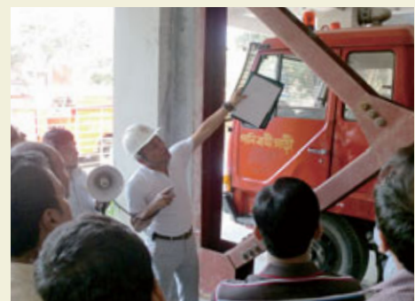
Un expert de la JICA anime une formation technique dans une caserne de pompiers récemment rénovée.

Pour renforcer la sécurité urbaine, la JICA a lancé un projet de prêt d'APD, le projet de sécurité des bâtiments urbains, en décembre 2015, afin d'améliorer la sécurité des bâtiments à Dacca et Chittagong, deux villes majeures qui représentent environ 15 % de la population et 50 % du PIB du pays. Parallèlement aux prêts à