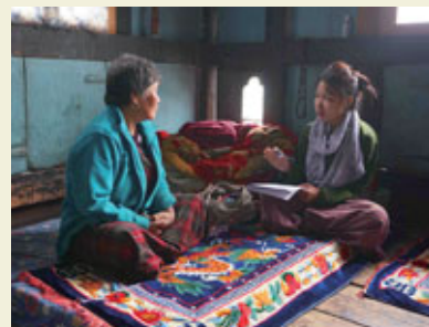
Interview dans le cadre de l'enquête sur le bonheur national brut.

Pour obtenir des résultats précis, il est fondamental d'utiliser des méthodes statistiques