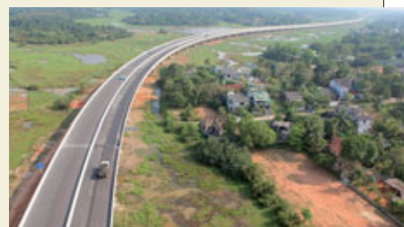
L'autoroute circulaire extérieure juste avant sa mise en service en septembre 2015.

Au Sri Lanka, le transport routier représente 90 % des transports terrestres de passagers et de fret, et joue un rôle essentiel pour les activités socioéconomiques du pays. La JICA continuera de soutenir le secteur des transports pour stimuler le développement économique et la réduction des disparités entre les régions.