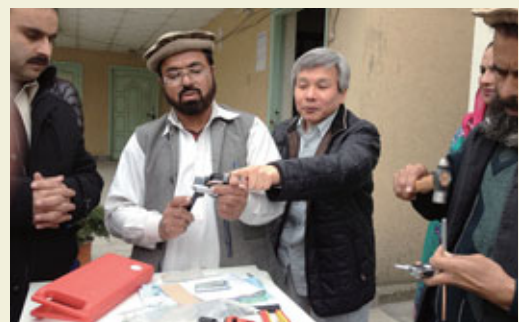
Formation sur la maintenance et la réparation des équipements destinée aux ingénieurs chargés des équipements du PEV au Pakistan.

Au Pakistan, parallèlement à la fourniture de dons en partenariat avec l'UNICEF, la JICA a assuré une coopération technique pour le projet de lutte contre la polio/PEV et accordé deux prêts d'APD au projet d'éradication de la polio (phases 1 et 2). Pour les prêts d'APD, la JICA a adopté un mécanisme financier innovant en collaboration avec la Fondation