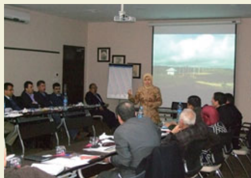
Membre du personnel d'une ONG indonésienne donnant une présentation.

En janvier 2016, une ONG indonésienne a organisé un atelier à Amman, la capitale de la Jordanie, pour discuter de l'énergie renouvelable et du développement communautaire pour les Palestiniens. Cet atelier a été le premier projet à utiliser le fonds CEAFAM et il a réuni un total de 21 participants du gouvernement, du secteur privé et des établissements d'enseignement des territoires palestiniens. Les participants ont eu un échange animé sur le développement communautaire et la