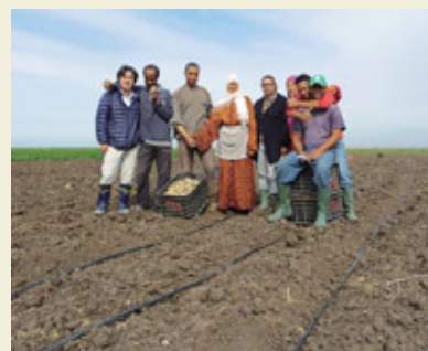
Des agriculteurs locaux et des experts de la JICA travaillent sur le projet d'amélioration du système d'irrigation.

À travers ce programme, des efforts sont entrepris pour diffuser à l'échelle nationale les résultats du projet d'amélioration du système d'irrigation de la zone irriguée de Doukkala,