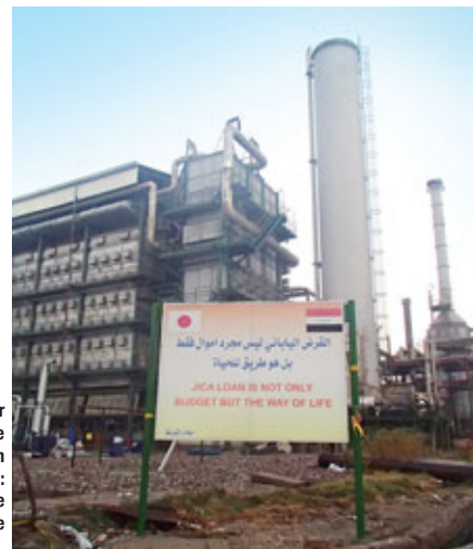
Irak : Un panneau placé par l'Agence de maintenance sur le site de réhabilitation d'une usine d'engrais dit : « Le prêt de la JICA contribue au budget et améliore notre mode de vie ».

Parallèlement à l'élaboration d'un plan de développement national en tant que lignes directrices pour la construction de la nation et au