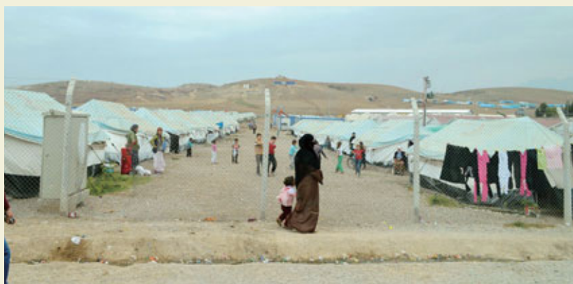
Un camp de réfugiés à Osmaniye, une ville du sud-est de la Turquie.

à long terme aux services de consultation, ainsi qu'aux investissements dans les installations d'approvisionnement en eau, d'assainissement et d'élimination des déchets des collectivités locales du sud-est de la Turquie. À travers ces initiatives, la JICA a pour objectif d'améliorer les infrastructures et le cadre de vie dans le pays.