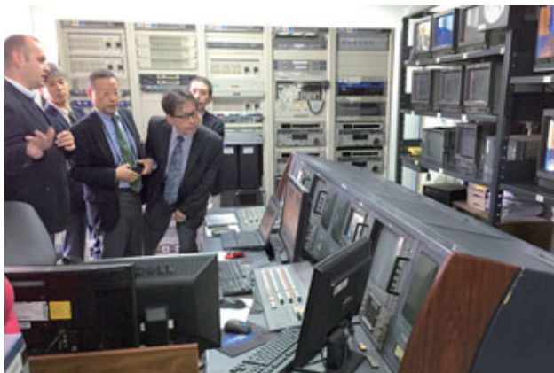
Des experts japonais dispensent une formation sur la production de programmes de radio et de télévision.

et en invitant des participants de Moldavie et d'Ukraine à suivre des formations au Japon.